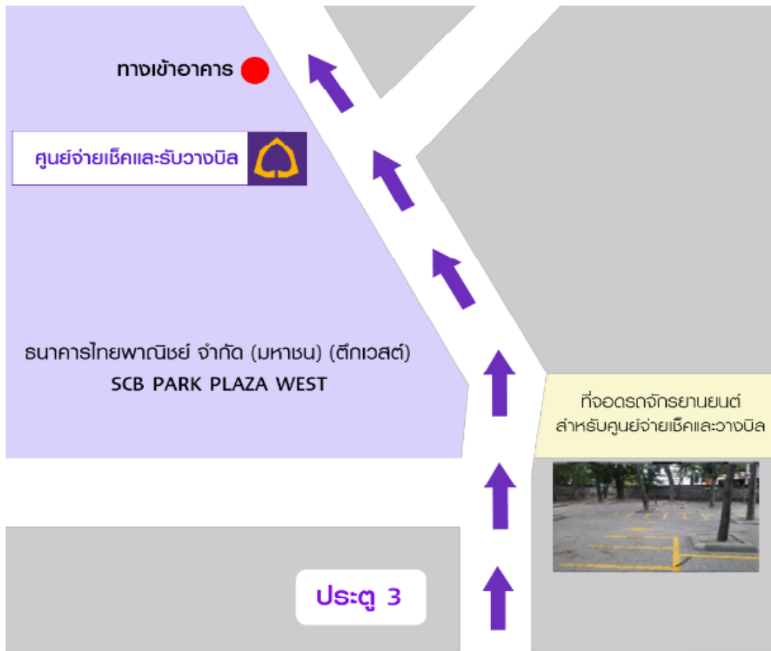
ณ. รัชดาภิเษก